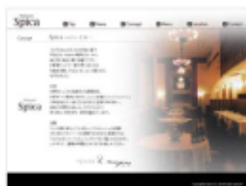
【 フリーページ (更新可) 】