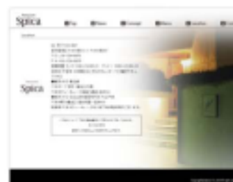
【 アクセスページ 】