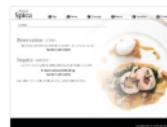
【 お問い合わせフォーム 】