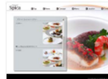
【 メニューページ 2 (更新可) 】