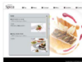
【 メニューページ 1 (更新可) 】