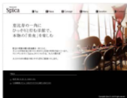
【 トップページ 】