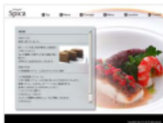
【 インフォメーションページ (更新可) 】